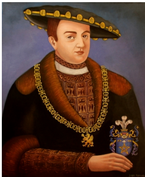
Богуслав Великий. 1515.

Родителями нашего персонажа были уже упомянутый Богуслав X Великий и его вторая жена Анна Ягеллон (6 декабря 1476—6 ноября 1503), дочь польского короля Казимира IV Ягеллон, внучка короля Германии, Австрии, Венгрии и Чехии Альбрехта II Габсбурга и правнучка императора Священной Римской империи Сигизмунда I Люксембургского.