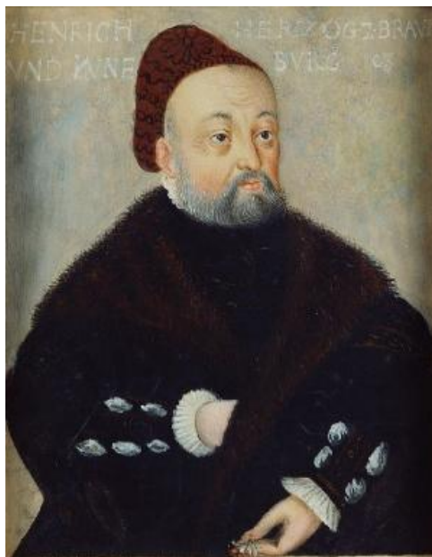
Генрих I Брауншвейг-Люнебург.