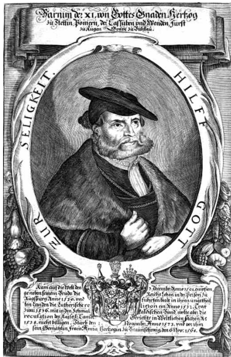
Барним IX (XI)

Трудно проводить сравнительный анализ облика человека с разницей в пятнадцать-двадцать лет, но мы попытаемся. Овальное лицо с прямым носом, небольшие миндалевидные глаза и рисунок бровей на всех портретах выявляют очевидное сходство и, как правило, являлись фамильными чертами Поморских герцогов, как у Богуслава X, у Георга I, так и у Барнима IX.