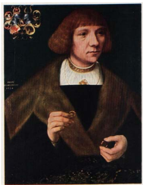
Якоб ван Утрехт. Фламандская школа. «Портрет мужчины с кольцами». 1524 г. Государственный Эрмитаж.

Живописные произведения, доносящие до нас образы людей, живших когда-то, всегда интересны. Они позволяют нам познакомиться с характерами, различными событиями скромного семейного или мирового значения, с модой того времени, обычаями, мелочами быта и многим другим. Одним из представителей Северного Возрождения, внесшего посильную лепту в развитие портретной живописи, являлся малоизвестный ныне художник Якоб ван Утрехт.