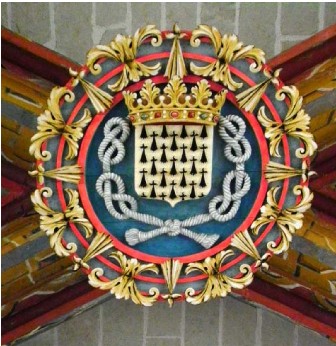
Шнур на гербе в соборе Нант

Отличительным знаком ордена был витой шнур, которым подпоясывал рясу святой. Этот символ обрамлял все вещи королевы, начиная от посуды и кончая вензелем на карете. Черный шнур обвивал и прелестное украшение, на котором двойной инициал имени отличившейся дамы изображался белой и красной эмалью.