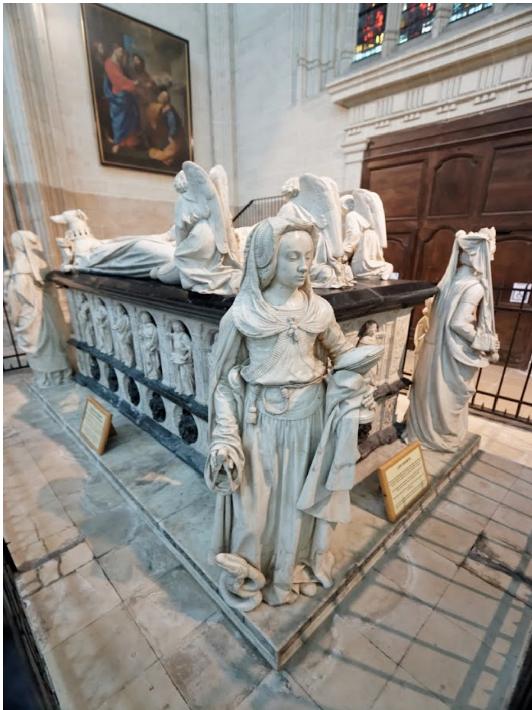
Нант, собор Сен-Пьер. Семейное надгробие герцогов Бретани. На переднем плане – статуя Справедливости, подпоясанная шнуром, с ликом Анны Бретонской

Своим родителям, герцогу Бретани Франциску II и герцогине Маргарите де Фуа, она поставила в соборе Нанта необычную гробницу, символику которой знаменитый французский мудрец Фулканелли объяснил в своей книге «Философские обители».