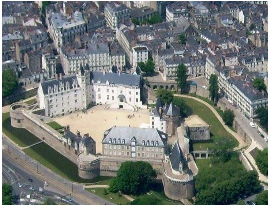
Нант. Замок герцогов Бретани