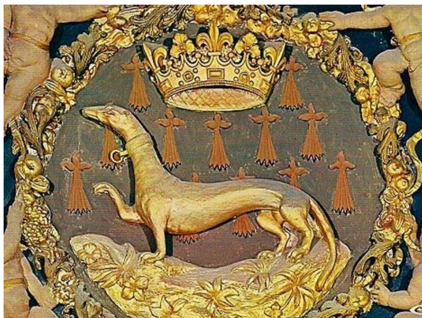
... горноста́й, который в геральдике обозначается черными хвостиками.