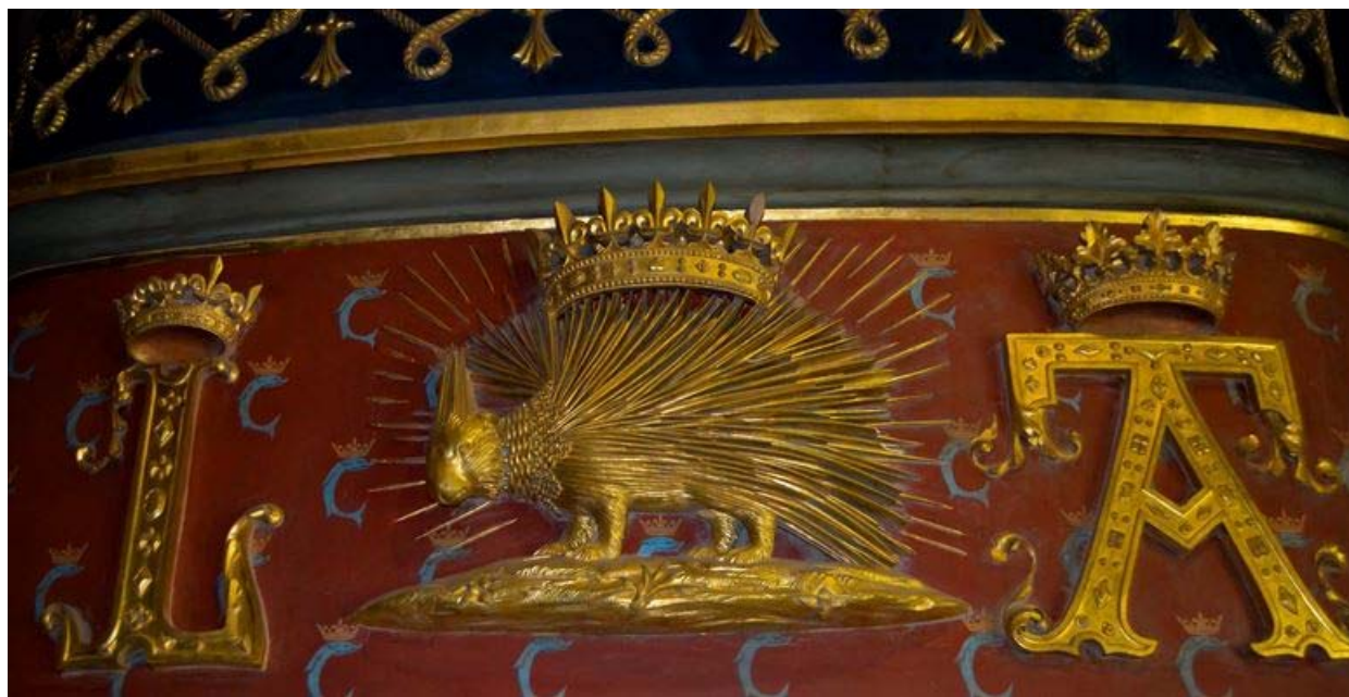
Символы супругов в замке Блуа: дикобраз и...