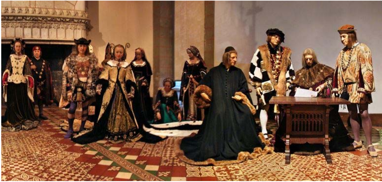
Сцена свадьбы Анны Бретонской и короля Карла VIII в замке Ланжэ

выпуклым золотым швом». Медовый месяц венценосная пара провела в комфортабельном замке Плесси де Тур, а потом супруги переехали в Амбуаз. Здесь король затеял грандиозное строительство, пригласив лучших мастеров той эпохи. И очень скоро замок превратился в изысканное жилище: изящные ножки королевы Анны тонули в ворсистых турецких коврах, взгляд падал на шпалеры на сюжет «Падение Трои» и другие великолепные гобелены. Вскоре семейное гнездышко украсили превосходные произведения искусства, которые король привез из завоевательного похода на Неаполь. Не забыл он и любимую супругу, подарив ей 1140 книг из библиотеки арагонских королей 5 . Их счастье омрачало лишь одно: дети умирали один за другим. Сначала покинул мир двухлетний дофин Карл-Орланд, которого не уберегли от оспы, потом - два мальчика и девочка, умершие, едва успев появиться на свет. Спустя семь лет после брака странная смерть настигла и самого Карла. Однажды вместе с Анной король поднялся на галерею Акельбак, чтобы посмотреть, как ведется строительство Амбуаза, и ударился об косяк двери. К вечеру он скончался. По обычаю королева на 40 дней затворилась от мира. Когда же траур закончился, все увидели Анну в черном наряде (до нее королевы носили траурные одежды белого цвета). По свидетельству хронистов, она пояснила, что всегда ровный и не имеющий оттенков черный цвет символизирует постоянство в любви.