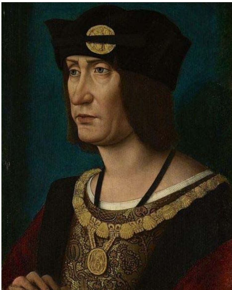
Избранник Анны, Людовик, герцог Орлеанский. В будущем он станет королем Людовиком XII, ее вторым супругом

Однако пройдет еще долгих одиннадцать лет, прежде чем им удастся преодолеть калейдоскоп походящих на фантасмагорию событий и соединить свои судьбы.