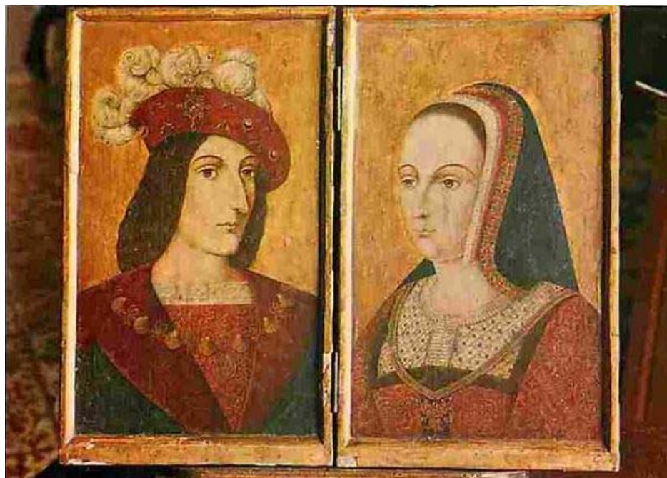
Портреты короля Карла VIII и королевы Анны в замке Ланжэ