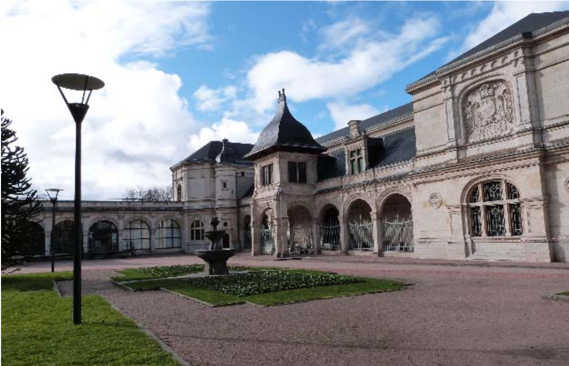
Мулен. Музей Анны де Боже

Чтобы лучше понять происходящее, проследим главные политические перипетии того времени. До совершеннолетия дофина Карла, будущего Карла VIII, государством на правах регента управляла его старшая сестра Анна, бывшая замужем за синьором де Боже. Почивший в бозе король Людовик XI высоко ценил ум, хитрость, находчивость и политическое чутье своей старшей дочери, называя ее «самой разумной женщиной во всем королевстве».