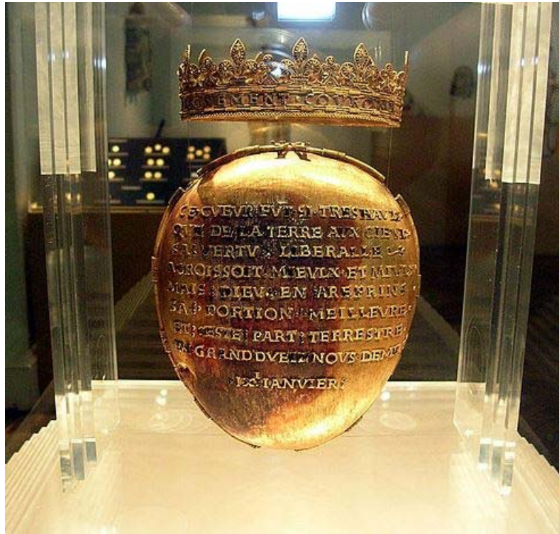
Сердце Анны Бретонской в золотой ампуле. Реликвия хранится в Нанте, в музее Добре

В конце концов, измученная частыми родами и отсутствием престолонаследника, Анна захворала. Врачи констатировали песок в почках, но как лечить болезнь – не знали. Испытывая беспрестанные приступы боли, королева умерла в Блуа в возрасте 38 лет.