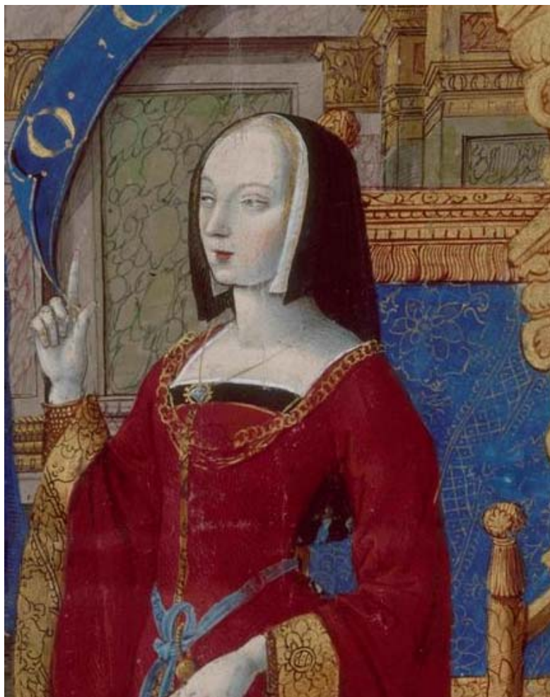
Портрет Анны Бретонской в замке Ланжэ

В обычные же дни она предстала перед своими поданными с волосами, убранными “под бретонский чепец в мелкую плиссировку” и в капе 11 , накинутом по тогдашней моде на элегантное платье.